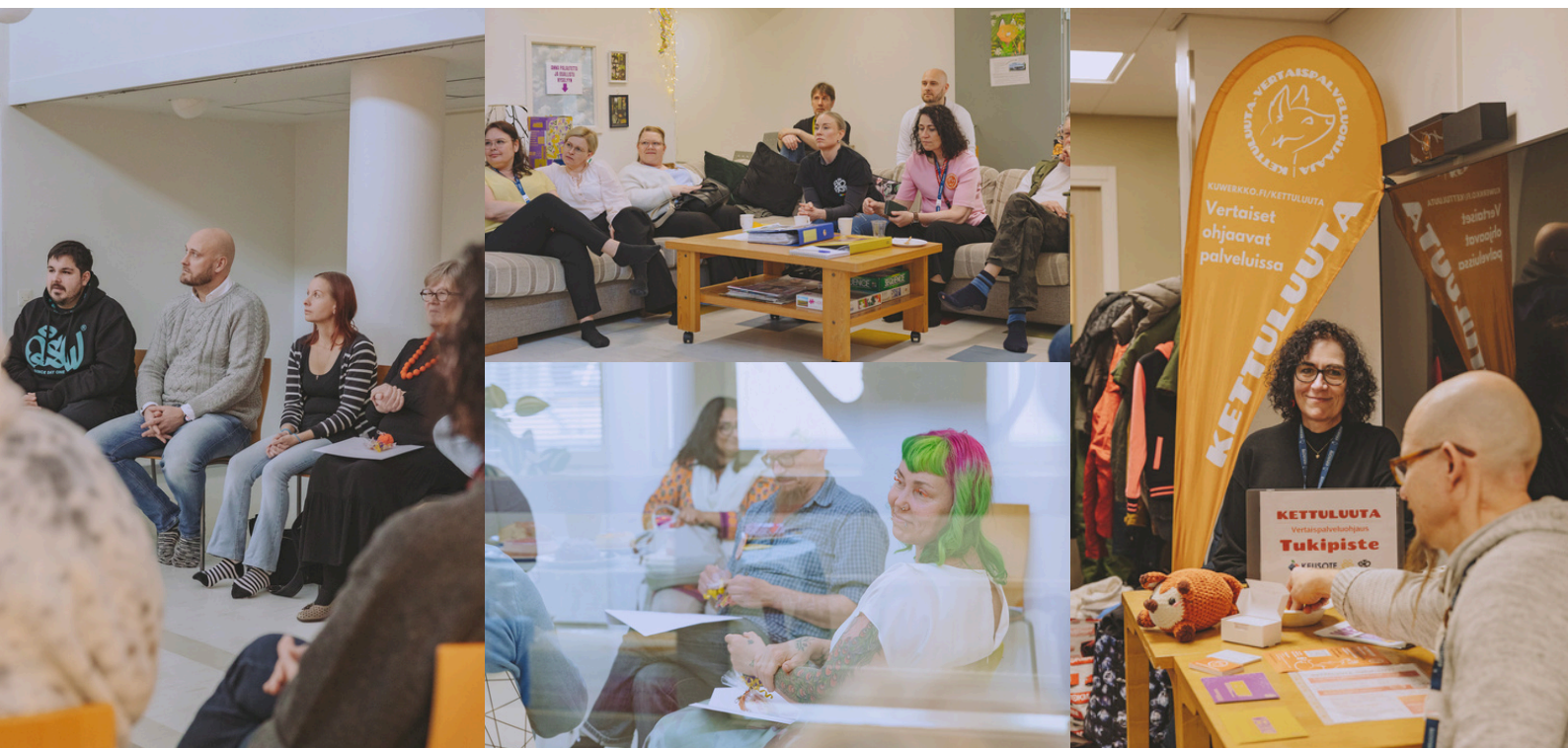
Kuvia Kettuluudan kehittäjäpäiviltä sekä kettuluuta-toiminnasta.

https://pokka.kukunori.fi/kuwerkko/k2026jarjestopaivatkuulijaksi