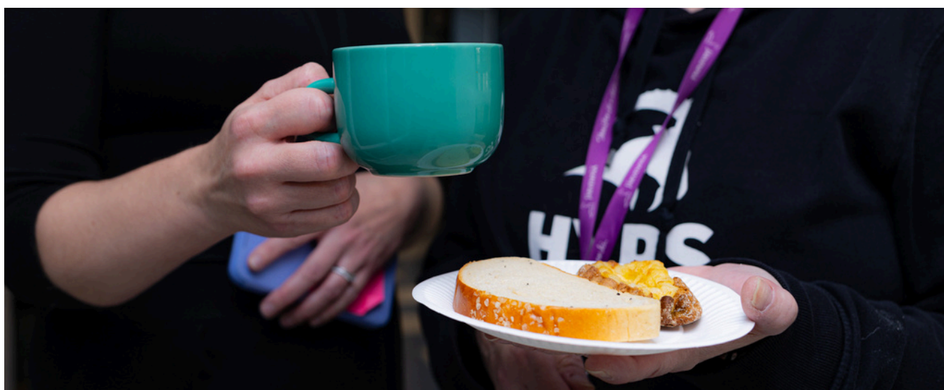
KUVA: URSULA ARSIOLA