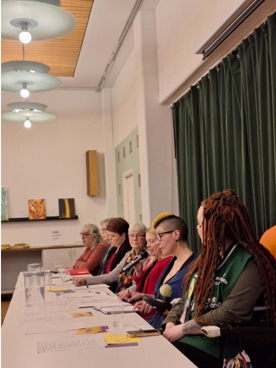
Werkon Aluevaalipaneeli.