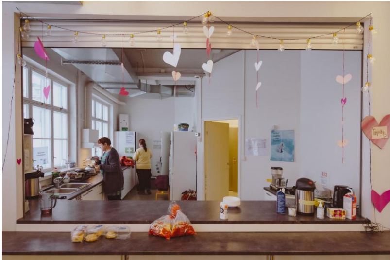
Werkon Järvenpään olohuone Nuorisotila Temalilla.