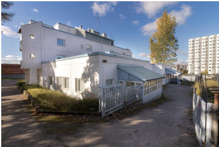
Werkkola (Kirjastokatu 4).

Werkkolan avoimet ovet pidettiin vuonna 2025 keskiviikkoisin klo 14–16 Werkkolassa eli Werkon toimitiloissa Järvenpään Kirjastokadulla. Avoimiin oviin voi tulla ohikulkiessaan kahville tai jäädä pidemmäksi aikaa oleilemaan, juttelemaan sekä istuskelemaan. Avoimissa ovissa kaikki halukkaat pääsevät vaihtamaan ajatuksia ja kuulemaan halutessaan myös Werkon toiminnasta. Avoimissa ovissa oli myös mahdollista saada lisätietoja siitä, miten Werkon toimintaan pääsee mukaan. Paikalla avoimissa ovissa vuoden 2025 aikana oli usein Werkon toiminnan aktiiveja, vertais- ja kokemustoimijoita ja vähintään kaksi Werkon työntekijää. Avoimissa ovissa kävi vuonna myös paljon uusia ihmisiä ja myös sotealan ammattilaisia tutustumassa toimintaan. Vuonna 2025 järjestimme yhteensä 47 avointen ovien tapahtumaa ja niissä toteutui yhteensä 555 kohtaamista.