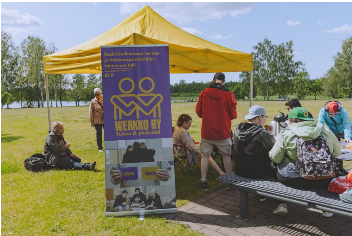
Werkon kesävirikistyspäivä Järvenpään Rantapuistossa.

Vuonna 2025 Werkko järjesti toiminnassaan mukana oleville ja siitä kiinnostuneille virkistystapahtumia. Helmikuussa 2025 järjestimme Werkon ystävänpäivän virkistysretken Järvenpään taidemuseoon. Kävijämme olivat toivoneet meiltä museokäyntejä. Kesäkuussa järjestimme Werkon jo perinteeksi muodostuneen virkistyspäivän Järvenpään Rantapuistossa. Werkon hallituksen ja työntekijöiden virkistyspäivä järjestettiin syksyllä 2025 Werkkolan tiloissa, jolloin valmistimme yhdessä tortilloja ja vietimme aikaa toisiimme tutustuen.