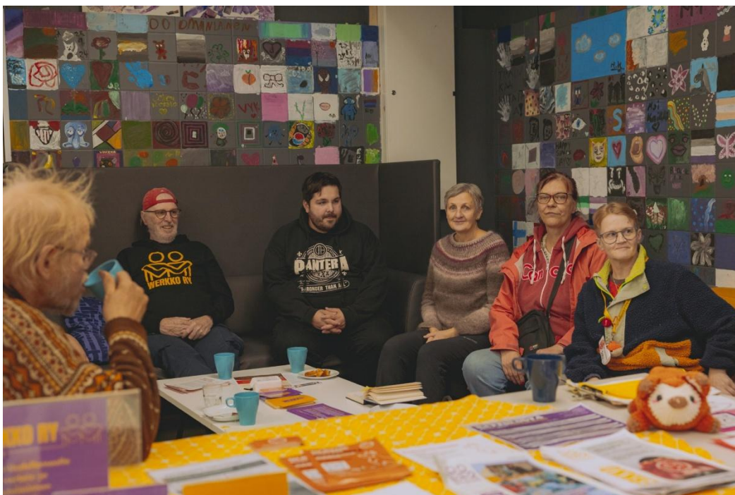
Werkkolaisia Järvenpään Asunnottomien yön tapahtumassa.

Osallistuimme Järvenpään kaupungin hyvinvoinnin palvelualueen palveluverkkotyöskentelyyn ja kaupungin kokoamaan, yhdistystoimijoista koostuvaan ”työnyrkkiin”. Jatkamme työskentelyä myös vuonna 2026. Osallistuimme myös Järvenpään kaupungin Järvenpää-päivään sekä Järvenpään Asunnottomien yö -tapahtuman suunnitteluun ja toteutukseen.