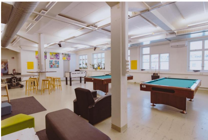
Werkon Järvenpään olohuone Nuorisotila Temalilla.