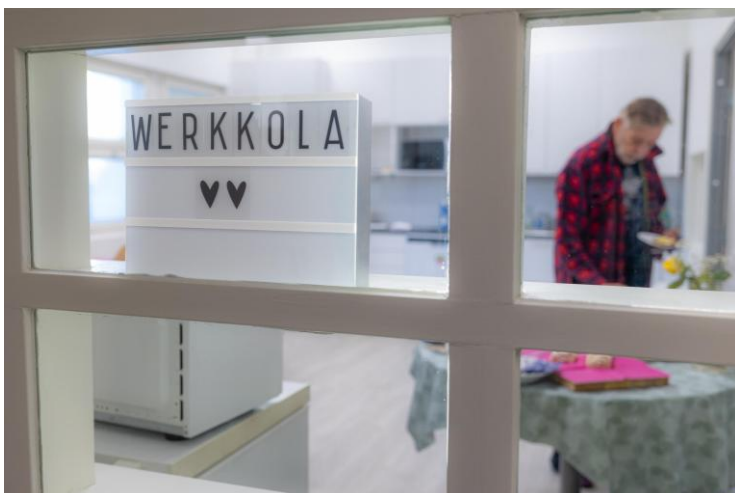
Werkkola (Kirjastokatu 4).