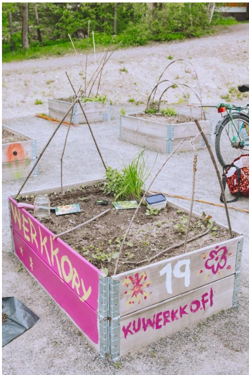
Werkon kasvatustilat.

Saimme Järvenpään kaupungilta kesän 2025 ajaksi käyttöömme istutuslaatikon, jonka hoitamiseen Werkon toiminnassa mukana olevat, esimerkiksi Avointen ovien kävijät, saivat osallistua kesän 2025 aikana. Osallistuimme istutuslaatikon avajaistapahtumaan ja kannustimme kävijöitämme mukaamme mm. istutuslaatikon maalaustalkoisiin. Kävijämme hoiti istutuslaatikkoa kesän 2025 aikana vapaaehtoisesti työntekijöiden kanssa.